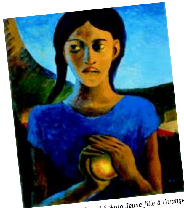
Gerard Sekoto Jeune fille à l'orange

INTRODUCTION La poésie africaine francophone est la poésie écrite par des Africains de langue française. La poésie africaine francophone est riche et variée. Deux écrivains de langue française célèbres sont Léopold Sédar Senghor et Aimé Césaire. Ces deux écrivains créent dans les années 30 le mouvement de «la négritude». La négritude, c'est «l'ensemble des valeurs culturelles de l'Afrique noire.»